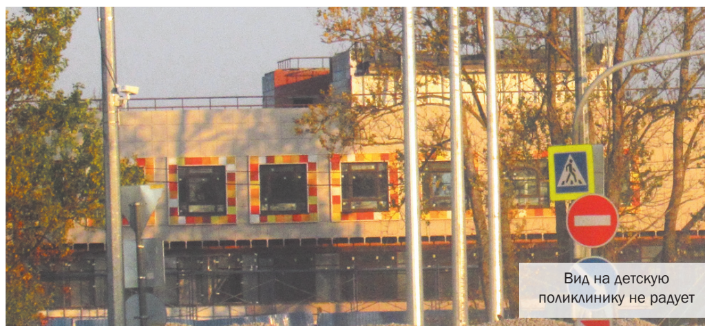
Вид на детскую поликлинику не радует

Взрослую поликлинику пока продолжает завершать ООО «Капитал стройиндустрия», пришедший на объект в начале этого года. А вот о стабильности стройки банного комплекса на ул. Рябчикова, сдача которого при хорошем раскладе запланирована на 10 декабря 2019 г., говорить вообще ещё рано. Всё, что там сделано до сих пор прежним подрядчиком, ООО «Строительная компания-77», а это фундамент, новому, в лице ООО «М-ГРУПП», придётся укреплять. Однако решение об усилении основания фунда-