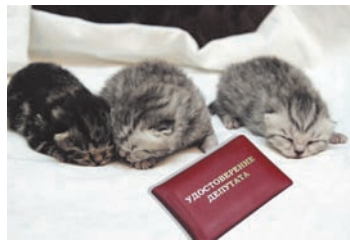
Котят с мандатами